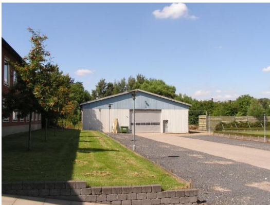
Saxovej 3 - hal