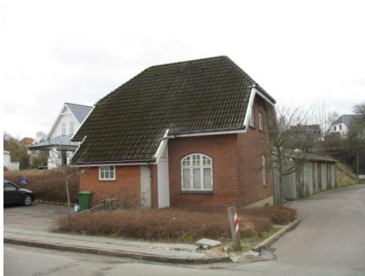
Olaf Ryes Gade 7 A - tidl. portnerbolig