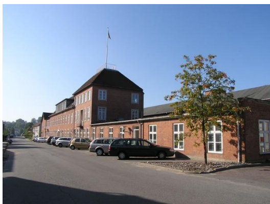
Olaf Ryes Gade 7 B-Z - facade