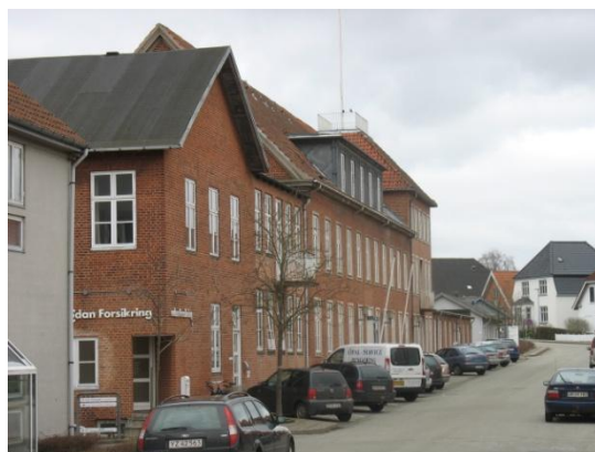
Olaf Ryes Gade 7 B-Z - facade