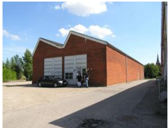
Saxovej 2-18 - værksted