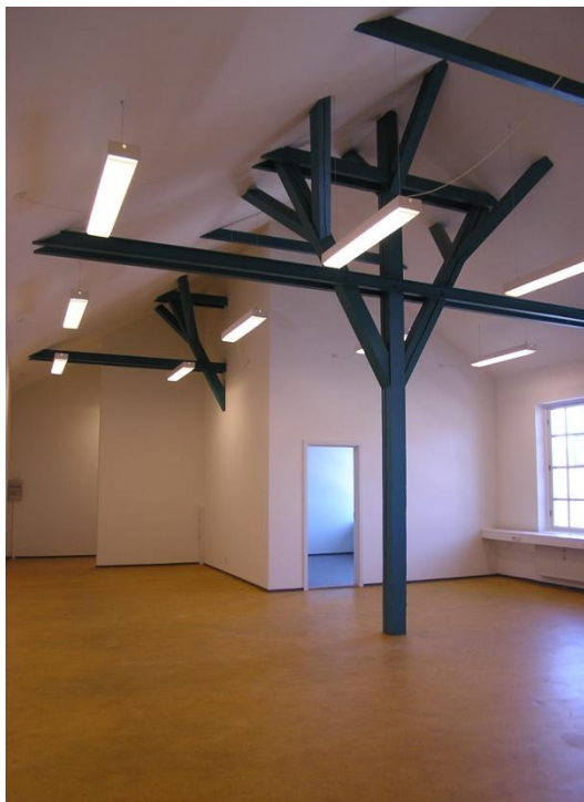
Olaf Ryes Gade 7 B-Z - kontor