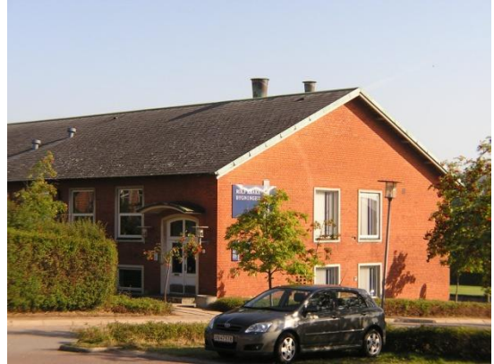
Saxovej 1 - kontorhotel