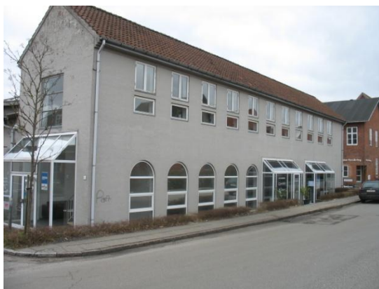
Olaf Ryes Gade 7 B-Z - kontor