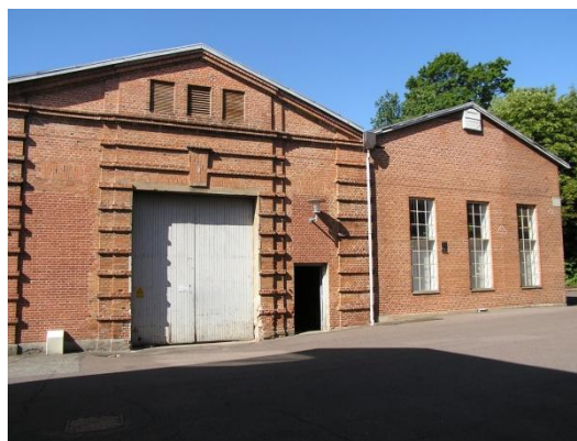
Olaf Ryes Gade 7 B-Z - lager