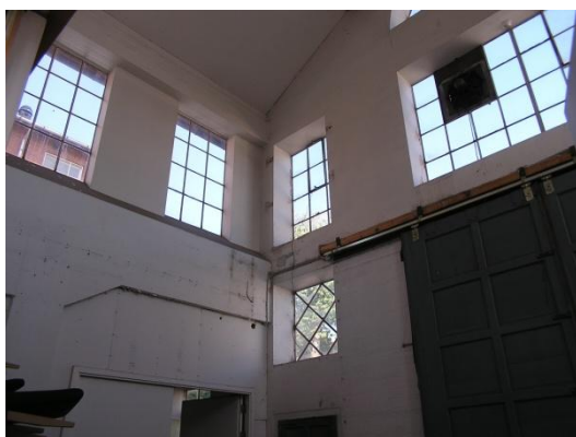
Olaf Ryes Gade 7 B-Z - lager