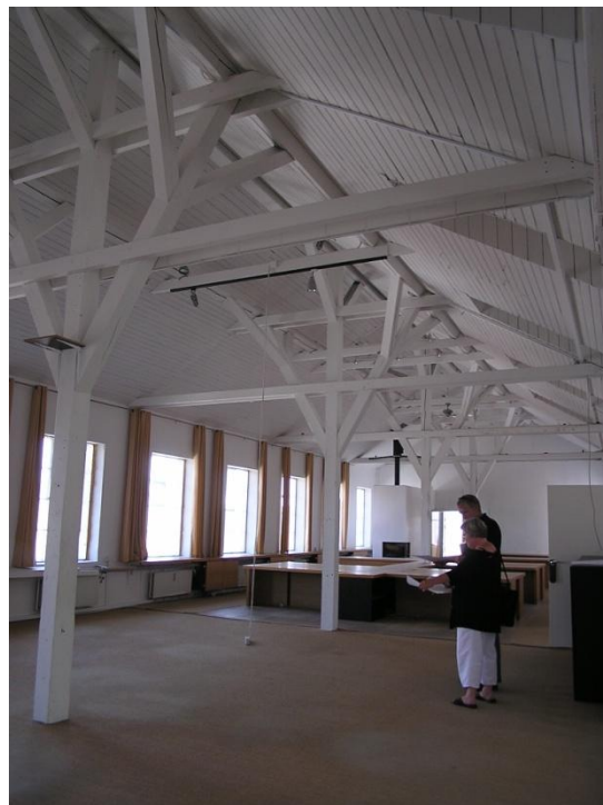
Olaf Ryes Gade 7 B-Z - kontor