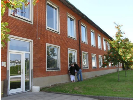
Saxovej 1 - kontorhotel