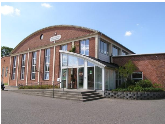
Saxovej 2-18 - fysioterapeut m.m.