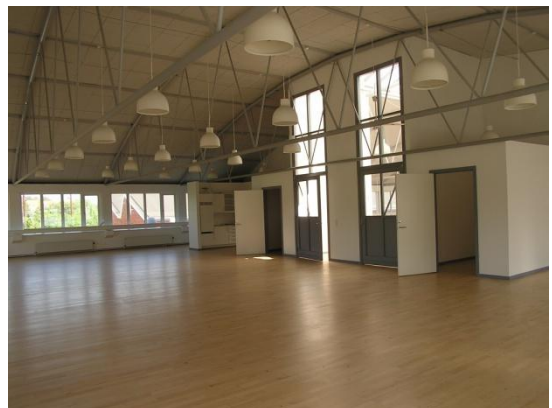
Saxovej 2-18 - undervisning