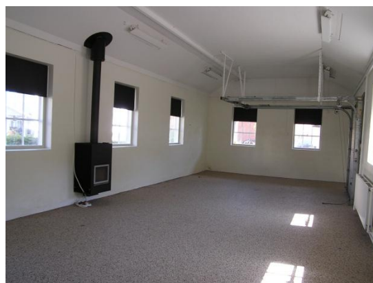
Olaf Ryes Gade 7 B-Z - værksted