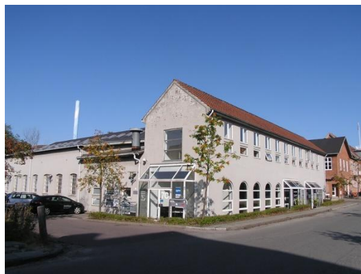
Olaf Ryes Gade 7 B-Z - kontor