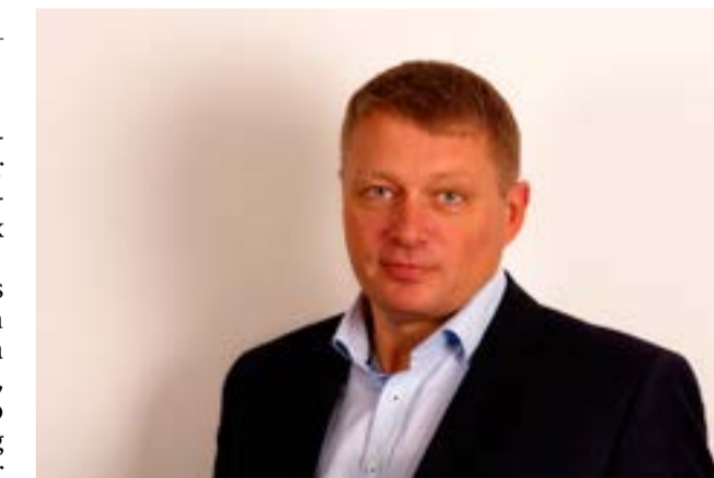
For store lokaler og bedre rekrutteringsmuligheder af nye medarbejdere er hovedårsagerne til, at Difko i løbet af sommeren flyttede fra Holstebro til Herning.

Vores lokaler i Holstebro var simpelt hen blevet for store til os, og da Herning ligger mere centralt i landet - også med hensyn til rekrutteringen - valgte vi at flytte hertil, og heldigvis har alle medarbejdere